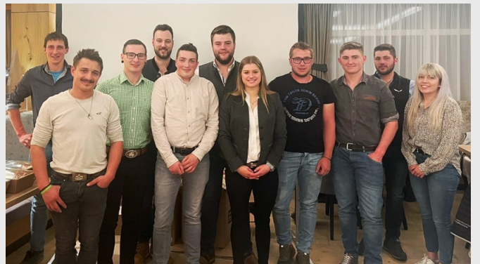
Der bisherige Vorstand, der mit viel Einsatz die Gemeinschaft sowie den Verein gefördert hat