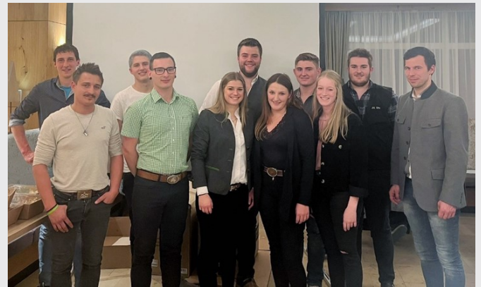
Der neu gewählte Ausschuss der Tiroler Jungzüchter der Ziegenrassen blickt motiviert nach vorn und freut sich auf die Zusammenarbeit der nächsten Jahre.

Gelegenheit, sich über gemeinsame Ziele und Visionen für die Zukunft der Tiroler Ziegenzucht auszutauschen.