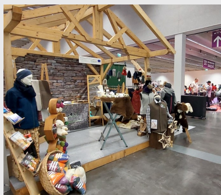
SenAktiv- und Kreativmesse

Neben den züchterischen Veranstaltungen, wie die Herbstausstellungen und auch die Absatzveranstaltungen nützen wir im Herbst wieder die Gelegenheiten uns auf einigen Messen zu präsentieren. Die Produkte von Schaf und Ziege sollen hier verstärkt in den Vordergrund gestellt werden, um dem Kunden die Vielfalt und Einzigartigkeit unsere Produkte zu vermitteln.